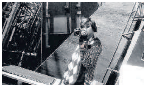
Cette photo en noir et blanc a été prise dans les coulisses de l'Opéra national du Rhin, à Strasbourg.

cours de cette visite, ils ont pris près de 1 000 clichés. Ils en sélectionneront une vingtaine afin de monter une exposition qui sera présentée à la médiathèque. L'image publiée ci-contre en fera partie. Les lycéens assisteront également à la représentation du spectacle « Aladin et la lampe merveilleuse », le 23 février, au théâtre de la Sinne, à Mulhouse.